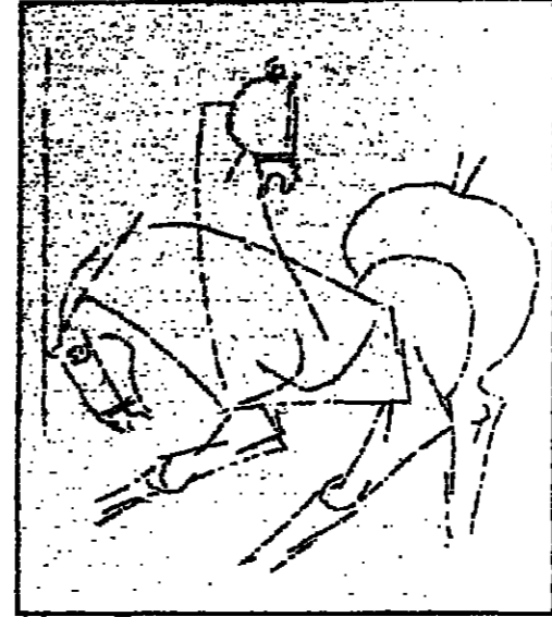
الحسان : رمز الاخلاق والاطلاق الاسطورة : يحرس نفسه من عين الشريرة

كان يتبول بين المشاعين ، حالي التميم ، اسر طون البيل ، وانتا كشت ، تشبه لحنه البعباب